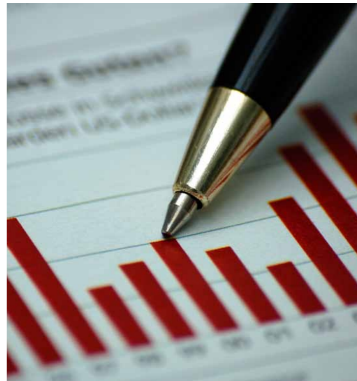
Bei der Änderung des Beherbergungsstatistikgesetzes besteht noch Regelungs- und Klärungsbedarf.

Laut Aussage des Statistischen Bundesamtes ist es nach Informationen des DTV möglich, die Abschneidegrenze national bei über 8 Betten zu belassen und trotzdem die Lieferbedingungen ab 10 Betten an die EU zu erfüllen. Technische oder datenschutzrechtliche Gründe, die dagegen sprechen könnten, sind aus Sicht des TVSH zu lösen und sollten nicht Anlass sein, diese wichtige Grundlage für die Ermittlung volkswirtschaftlicher Umsätze sowie des daraus abgeleiteten Kapazitätsbedarfs und der Beschäftigungseffekte der Tourismusbranche ohne Not aufzugeben.