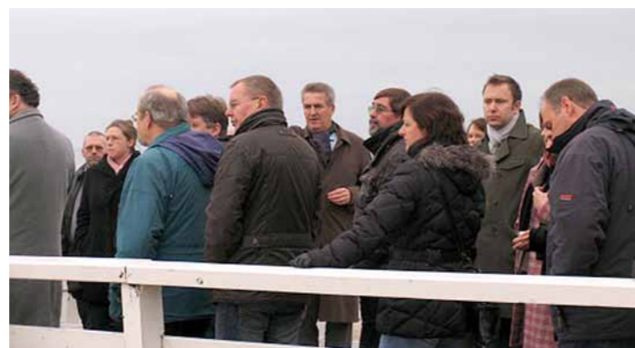
Teilnehmer der Veranstaltung bei der Vorortbesichtigung in Timmendorfer Strand

Der TVSH plant in den nächsten Monaten, in Abstimmung mit dem Innenministerium, für ausgewählte Modellregionen in einem moderierten Prozess die Entwicklung von Anpassungsstrategien an den Klimawandel im Bereich Küstenschutz voran zu treiben. Für Anfang 2012 ist, in Zusammenarbeit mit der Universität Rostock, eine weitere Veranstaltung geplant.