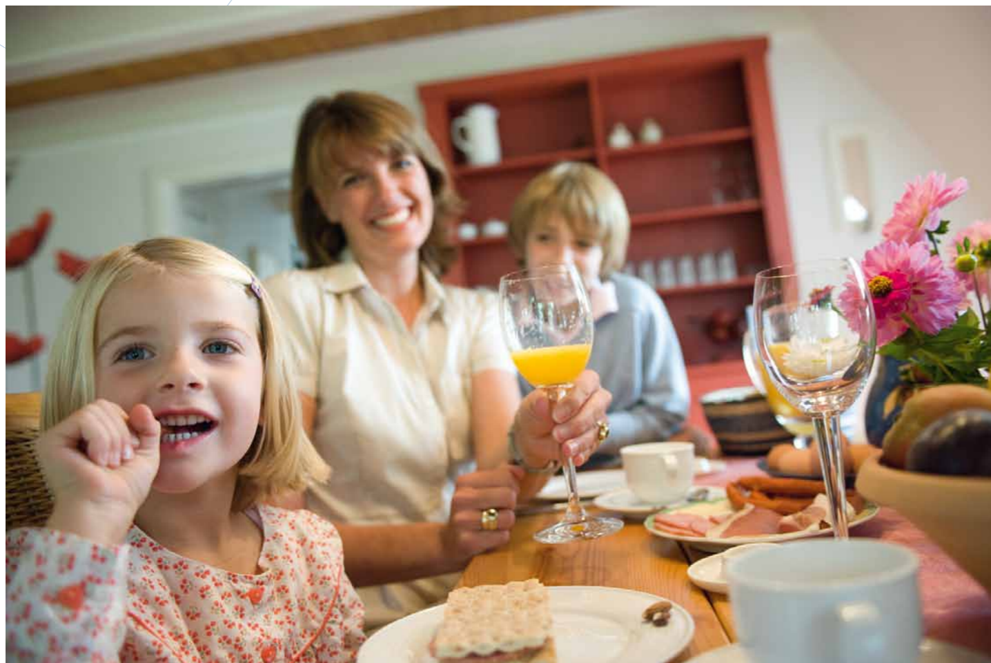
Die Ergänzungszertifizierungen sind ein wichtiges Marketinginstrument und sichern einen hohen Standard.