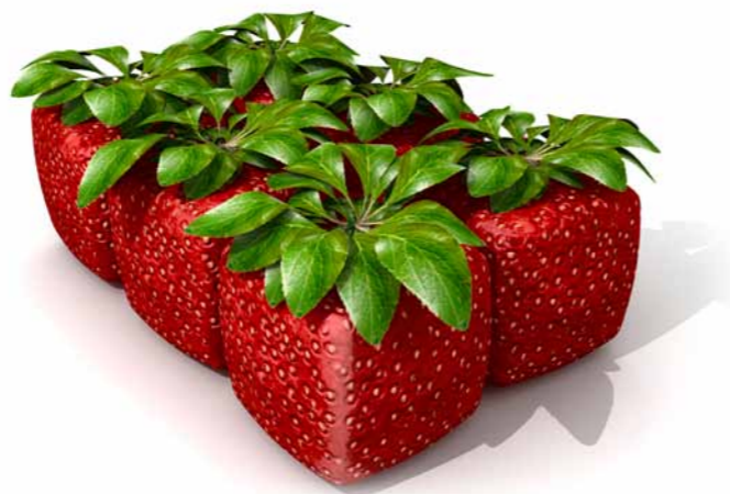
Der Tourismuspreis Schleswig-Holstein zeichnet echte Innovationen aus.

Der nächste Tourismuspreis wird voraussichtlich im November 2012 ausgelobt.