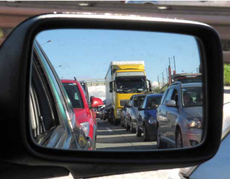
Baustellen und Bahnstreiks erschwerten in 2011 die Anreise der Gäste.