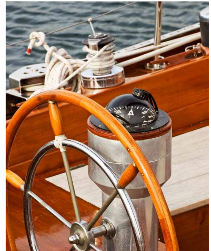
Kurs halten für eine erfolgreiche Tourismuspolitik des Landes

Der TVSH erwartet eine klare und offene Positionierung des Landes, wie es sich zukünftig seine Aufgaben im System Tourismus vorstellt und welche verlässlichen Instrumente zur Förderung des Tourismus in Zukunft bereit stehen.