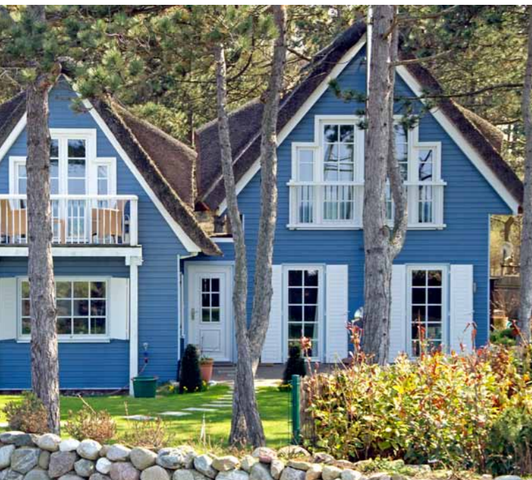
Mit Hilfe des Modellprojektes sollen die tatsächlichen Unterkunfts-kapazitäten in Schleswig-Holstein erfasst werden.