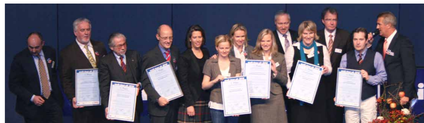
Die Gewinner der web.tour.sh 2010 bei der Verleihung am Tourismustag in Norderstedt