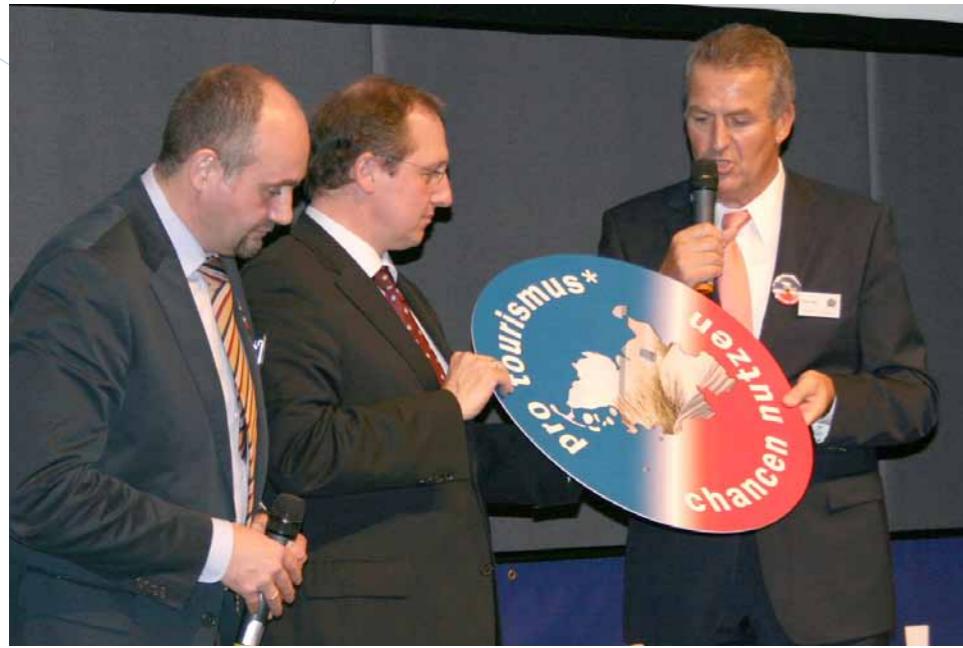
Flagge zeigen – Minister de Jager auf dem schleswig-holsteinischen Tourismustag 2010