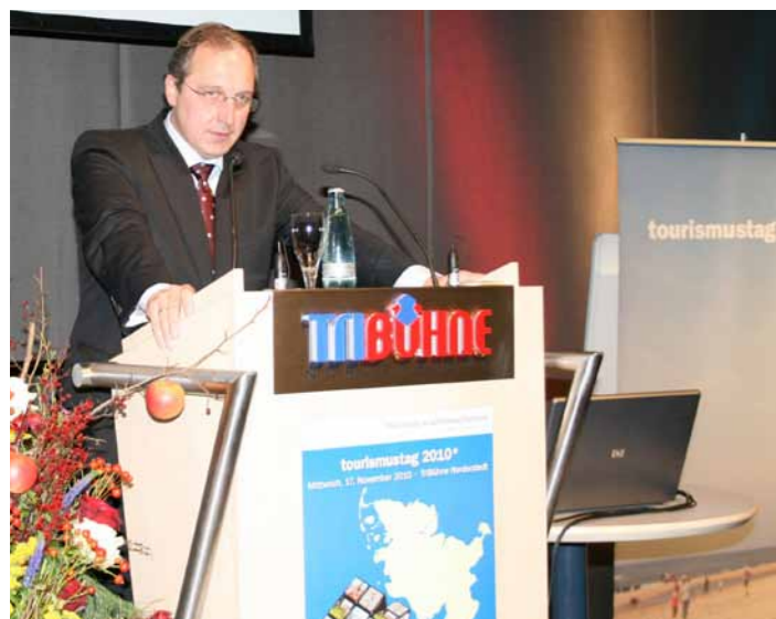
Minister de Jager beim Tourismustag 2010 in Norderstedt

Das Motto des diesjährigen Tourismustages Schleswig-Holstein lautet: „Tourismus in Schleswig-Holstein – wir machen uns stark für Fachkräfte“. Die Veranstaltung findet am 3. November 2011, im NordseeCongress-Centrum in Husum, statt. Das Schwerpunktthema „Fachkräftegewinnung und -sicherung“ soll anhand von Vorträgen und Best Practice Beispielen den Gästen näher gebracht werden und dabei folgende Fragen diskutiert werden: „Welche Chancen hat die Tourismuswirtschaft im Wettbewerb um Berufsnachwuchs und Fachkräfte? Wie steht es mit dem Image der gastgewerblichen Berufe und was kann getan werden, um den Auswirkungen des demografischen Wandels zu begegnen?“