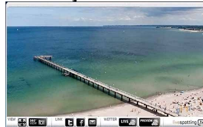
Livespotting TV System von Timmendorfer Strand