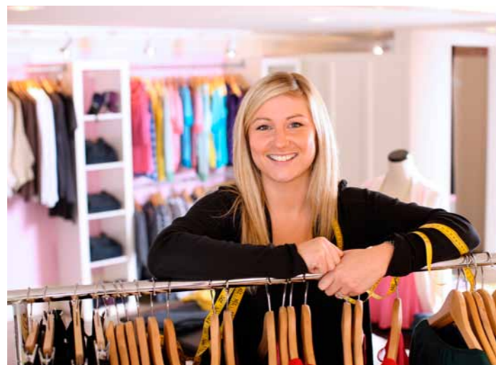
Der Einkaufsbummel gehört zu den beliebtesten Aktivitäten im Urlaub.

Der TVSH kann die Klage gerade vor dem Hintergrund der konstruktiven Gespräche mit den Kirchenvertretern nicht nachvollziehen und hat seine Positionen im Juli 2011 noch einmal in einer Pressemitteilung zum Ausdruck gebracht. Angesichts der großen Bedeutung, die der Tourismus für die Wirtschaftskraft und Arbeitsplatzsituation des Landes hat, würde eine Einschränkung der bestehenden und bewährten Regelung gravierende Folgen für die Tourismuswirtschaft haben. Der TVSH wird sich daher konsequent für die Beibehaltung der bestehenden Bäderverordnung einsetzen.