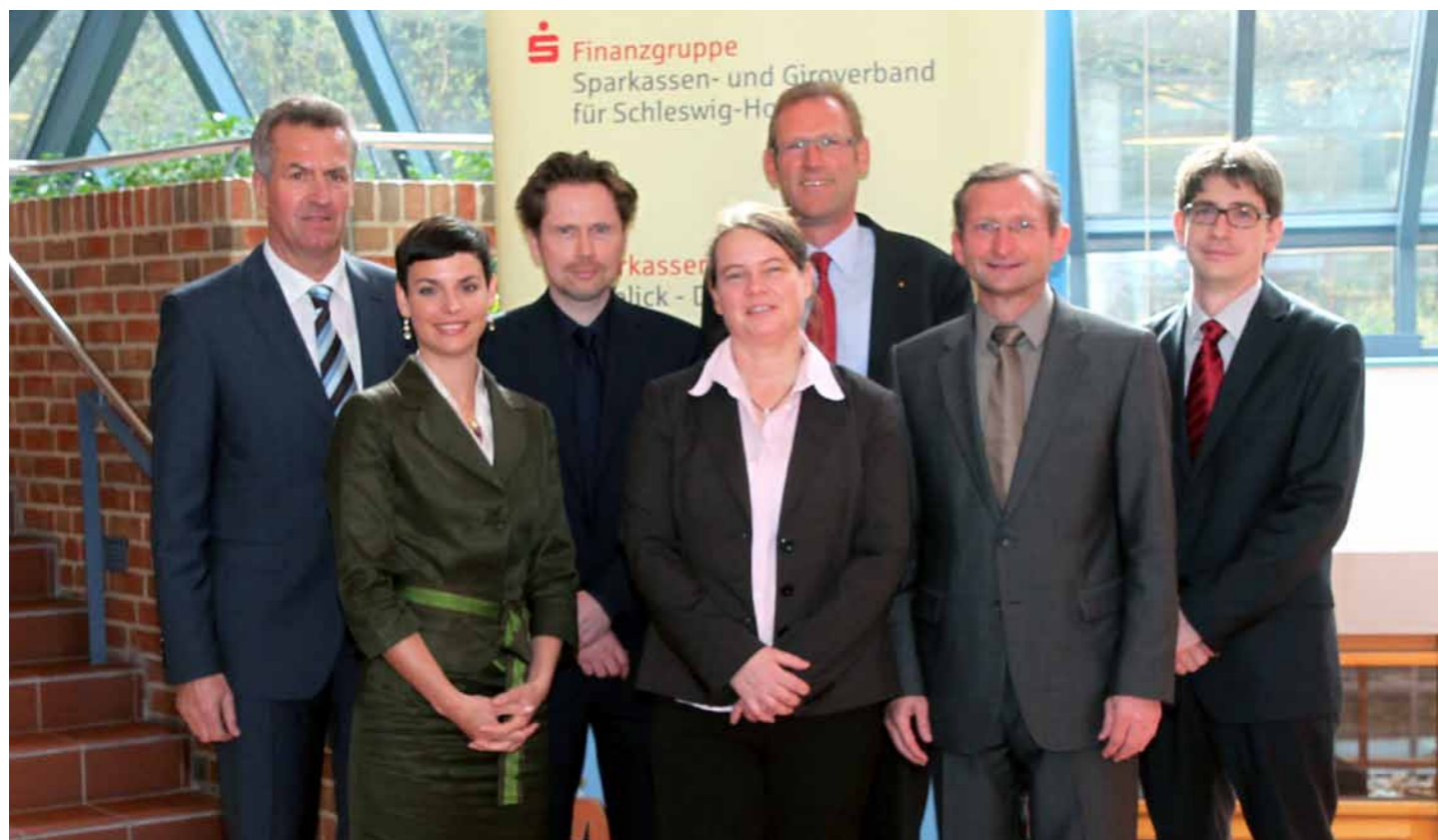
Initiatoren und Referenten der Veranstaltung zum Sparkassen-Tourismusbarometer am 12.04.2011